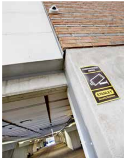
▲ Kameraet fanger opp trafikk ut og inn fra garasjeanlegget.